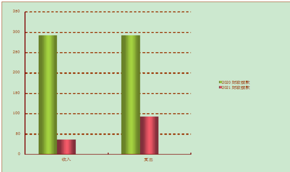
图 2：2020-2021 年财政拨款收支情况